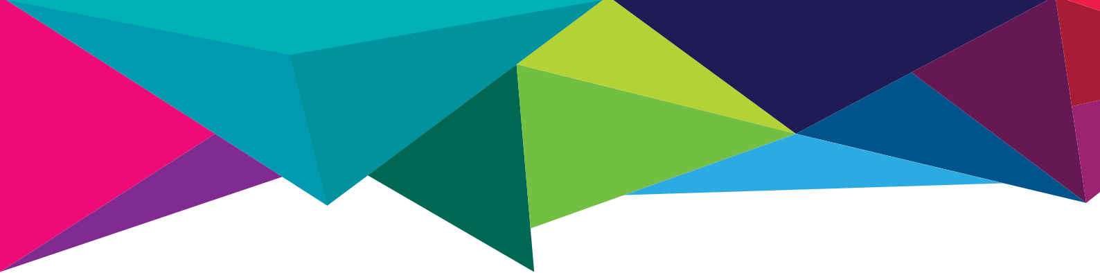
Tabela de Conteúdos